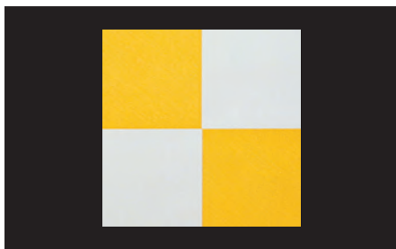
市松懐敷 金銀(200枚入)