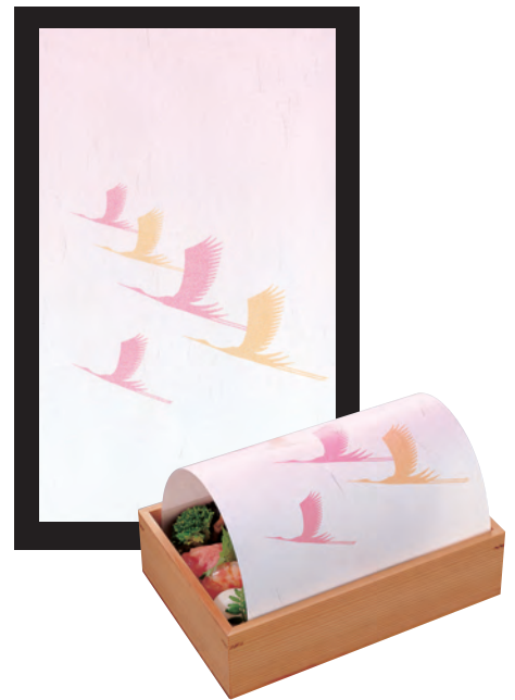
寿・ドーム掛紙 祝鶴(200枚入)

19-319-02(64486) 4,600円(1枚当り23円) 約17.5×28.5cm