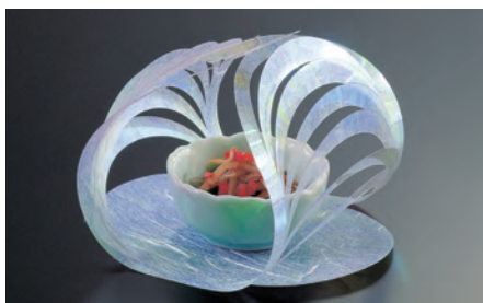
オーロラマリモ(100枚入)